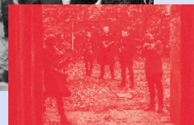
RADICAL POLISH ANSAMBL